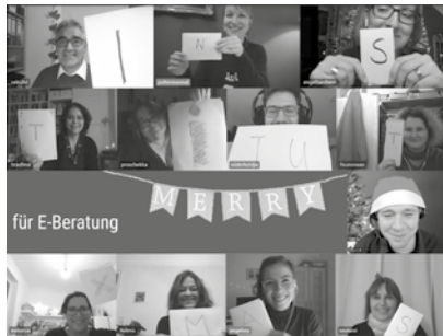
Erstes digitales Fachforum Erste digitale Weihnachtsfeier